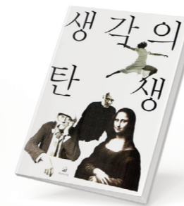
그림 2. 생각의탄생(책)

“모형은 해당 대상의 구조와 기능에서 가장 중요하고 결정적인 요소만을 추출한 것이다.”